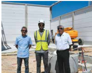
Visite du chantier RTE.