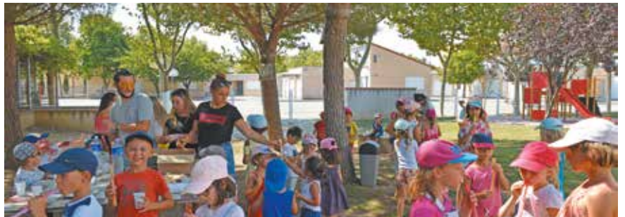
Fête à l'Accueil des loisirs.