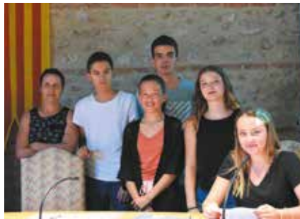
Le CCJ au Conseil municipal.