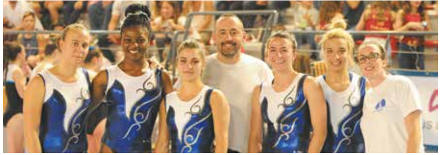
Championnat de France de gymnastique à l'Espace N. Mandela.