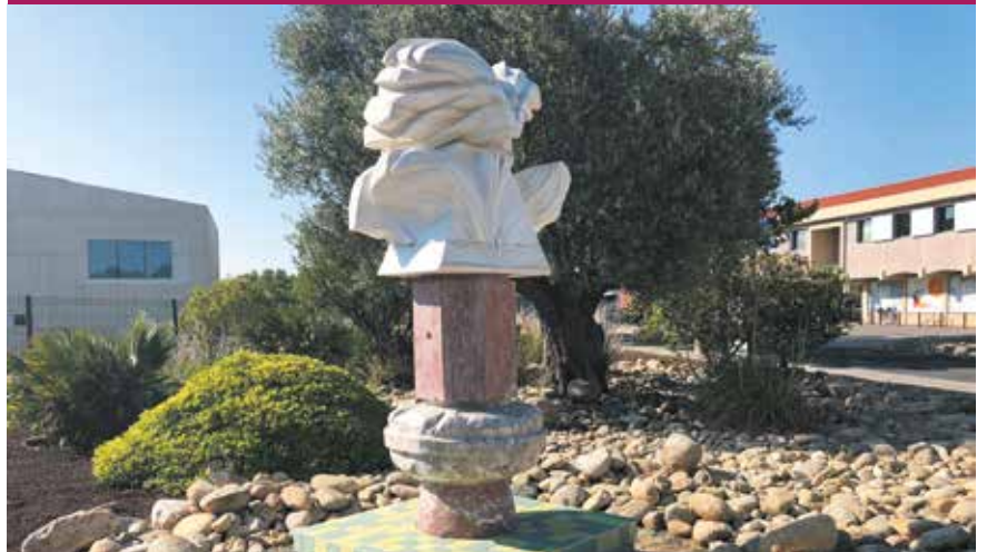
Hommage à Pierre Moreels. Sa dernière sculpture pour la ville : L'Oiseau Liberté.