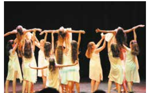
Juin des ateliers.