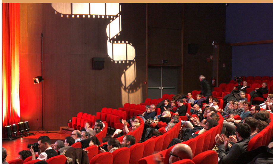
LES RENCONTRES DU COURT-MÉTRAGE

Du lundi au vendredi dès 7h20 ou en podcast sur le site de la radio.