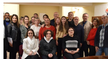
Recensement de la population 2020, nos agents recenseurs en janvier.