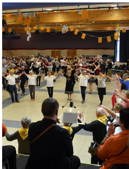
40 ème APLEC de Sardanes, le 2 février.