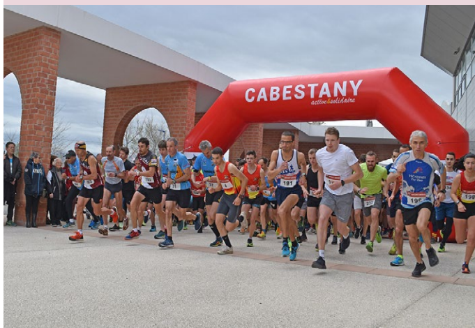
LA CABESTANYENCA, LE 1 er MARS