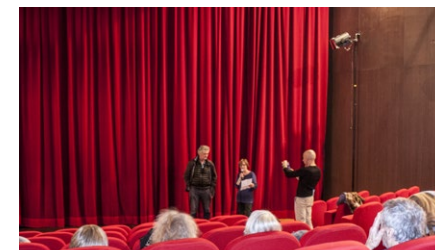
Soirée droits des femmes en présence du réalisateur Gérard Mordillat, le 13 mars.