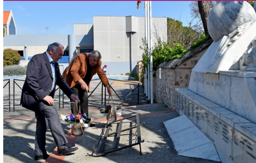
Commémoration du 19 mars.