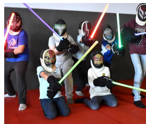
Stage de sabre-laser, le 10 février.