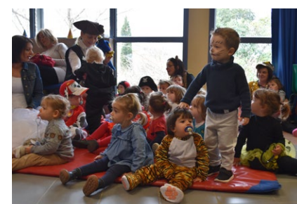
Carnaval à la crèche, le 25 février.