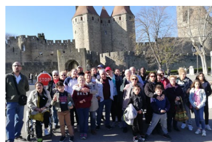
Sortie familiale, le 15 février.