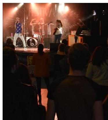
Festival en Kit, le 21 février.