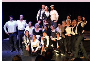
Murmures de tranchées Spectacle participatif.