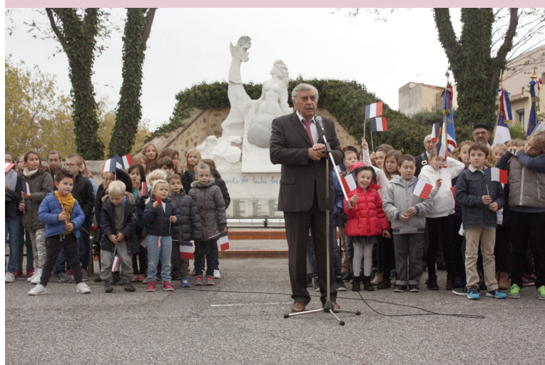
Cérémonie du 11 novembre.