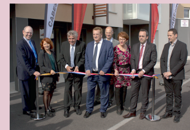
Inauguration du lotissement Les portes de la mer.