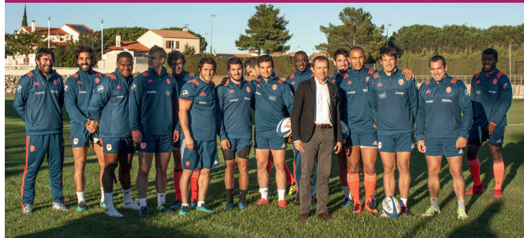
Entraînement de l'équipe de France de Rugby à XV à la Germanor.