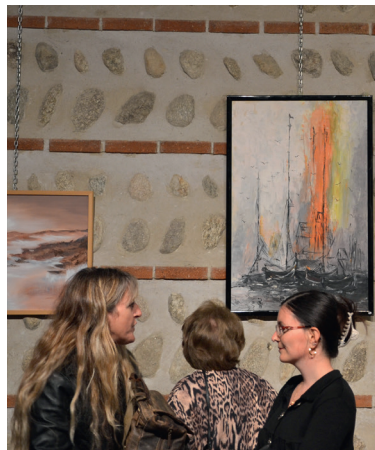
Vernissage Cabes' expose à Cabes'.

Us desitgem a tots unes bones festes de fi d'any. Bon Nadal i felicitats any nou.