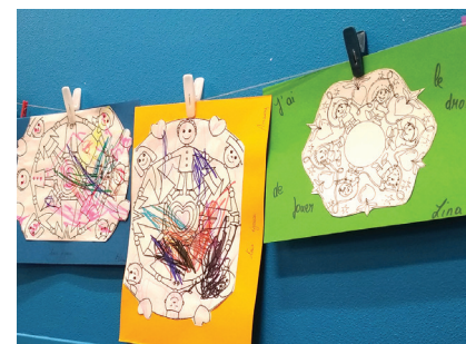
Les Droits de l'enfant à la crèche.