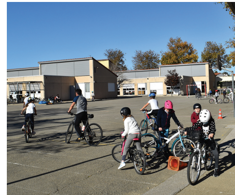
"Savoir rouler à vélo" - école J. Prévert.