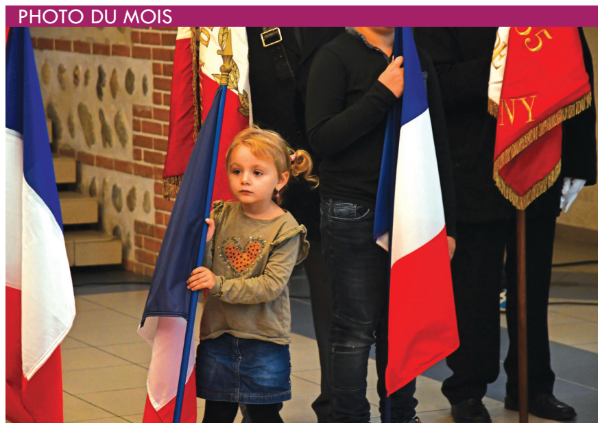
Commemoration du 11 novembre.