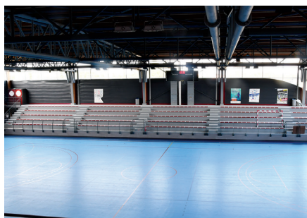
Réfection du sol sportif de l'Espace Nelson Mandela.