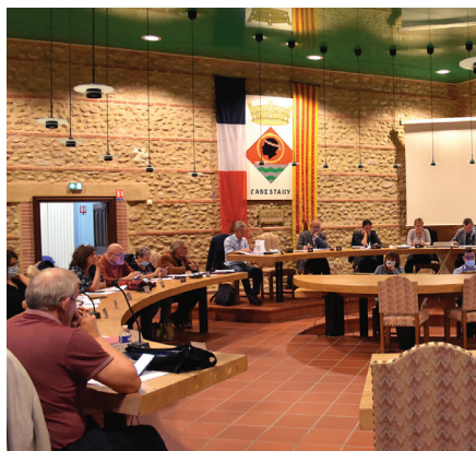
Retour du conseil municipal à la Mairie.