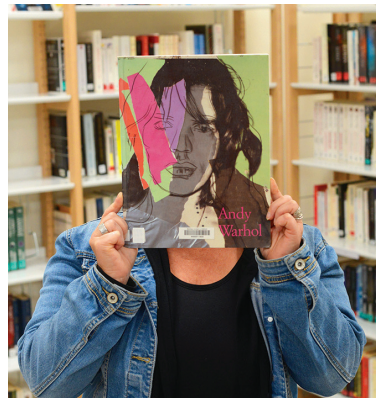
Atelier Bookface à la bibliothèque.