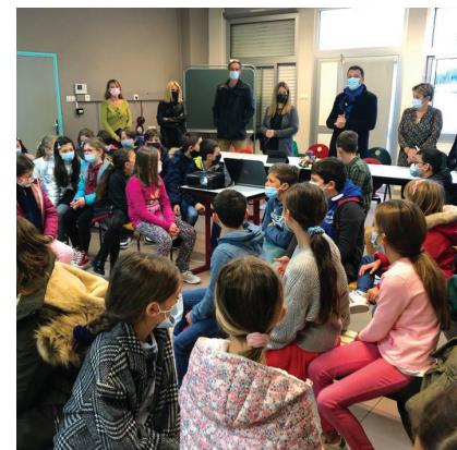
Remise du prix "Roboteam" aux élèves de CM1 de l'école Buffon.