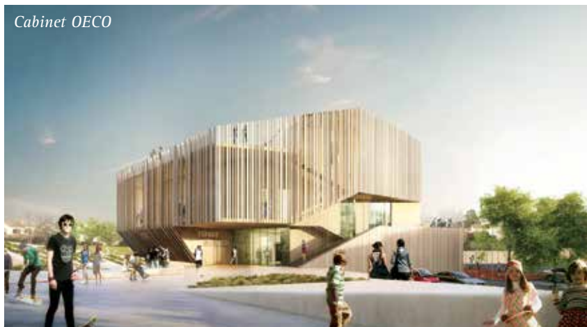
LE PROJET ESPACE JEUNESSE