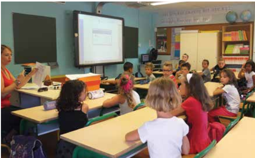
TABLEAUX BLANCS INTERACTIFS DANS TOUTES LES CLASSES ÉLÉMENTAIRES