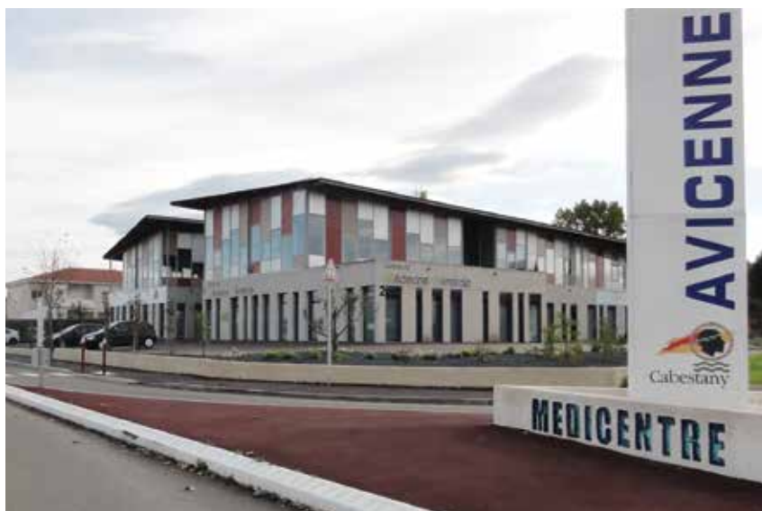
LE PÔLE DE SANTÉ MÉDICENTRE/AVICENNE

Place des Droits de l'Homme, Cabestany. Tél. : 04.68.66.36.28.