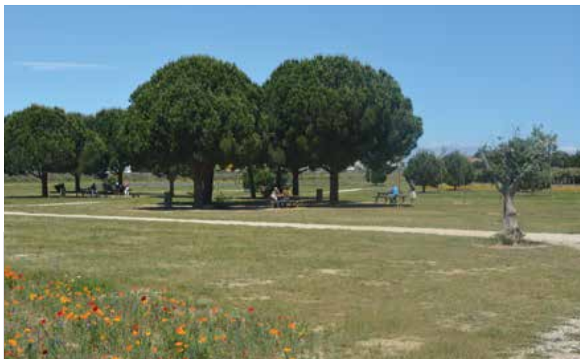
LE BASSIN SAINTE CAMILLE

La Ville s'est engagée dans un plan intercommunal d'amélioration des pratiques phytosanitaires et horticoles. Un programme d'actions sera proposé prochainement et présenté lors d'une réunion publique courant 2015. Le recours à une quantité moindre de produits phytosanitaires aura pour conséquence de la végétation sur les trottoirs. Mais accepter un peu plus d'herbe, c'est participer à la préservation des nappes phréatiques.