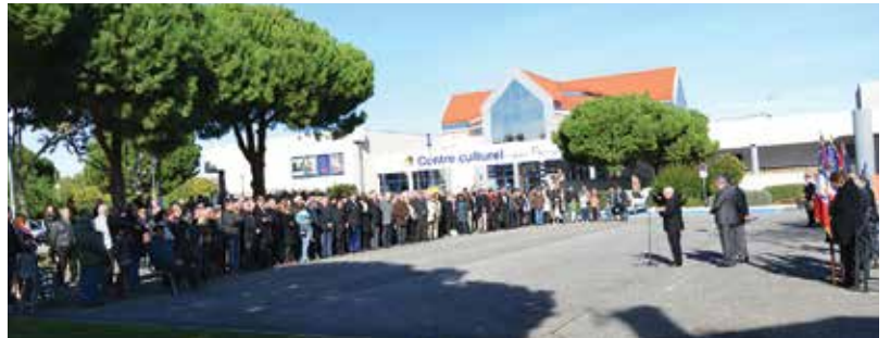
Commémoration du 11 novembre 1918.