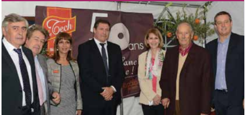
La Confiserie du Tech a fêté ses 50 ans !