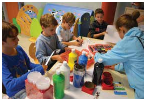
Les Temps d'Activités Péri-scolaires (TAP).