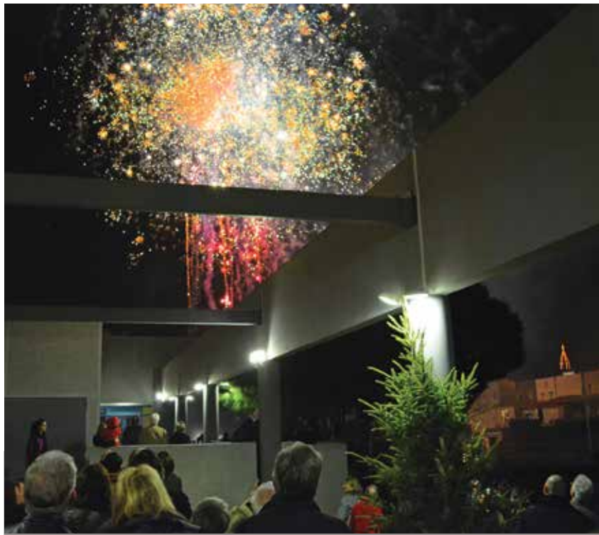
CÉRÉMONIE DES VŒUX À LA POPULATION LE MARDI 6 JANVIER

SÉANCES DE MOTRICITÉ* Avec le RAM. De 10h à 11h. Espace N. Mandela.