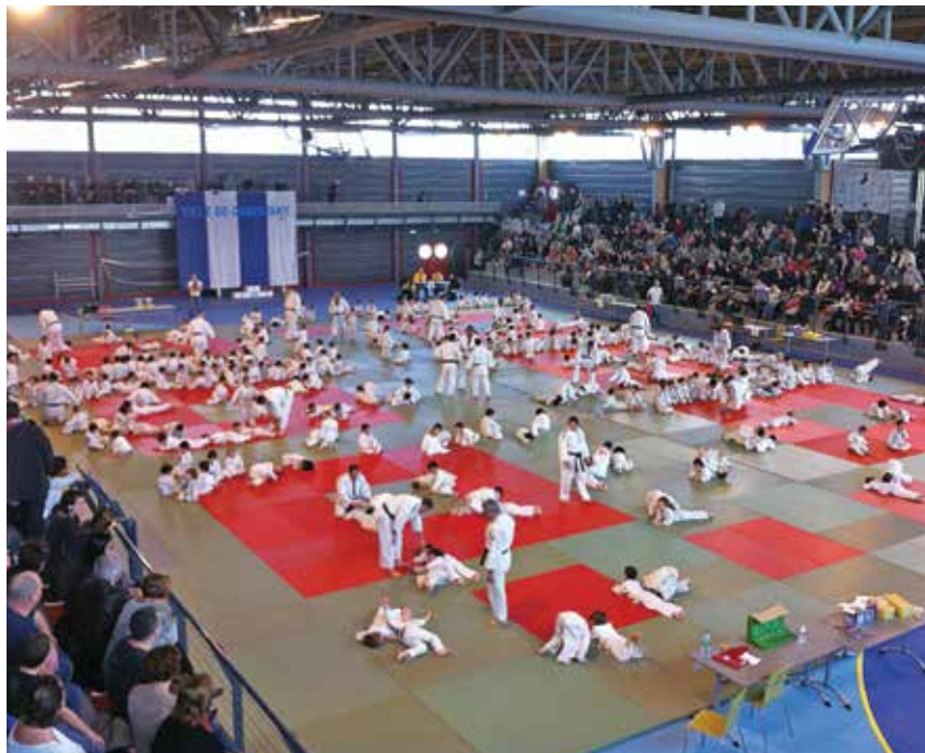
RENCONTRE DE 1 000 JUDOKAS EN JANVIER 2014

Camp de la Germanor. Tél. : 04.68.80.38.69.