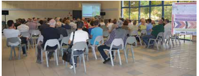
Révision du PLU : 1 re réunion publique.

Le Secours populaire a sollicité le centre social de la Maison des Quartiers pour organiser une collecte de produits d'hygiène qui ont été redistribués aux plus démunis de la Commune.