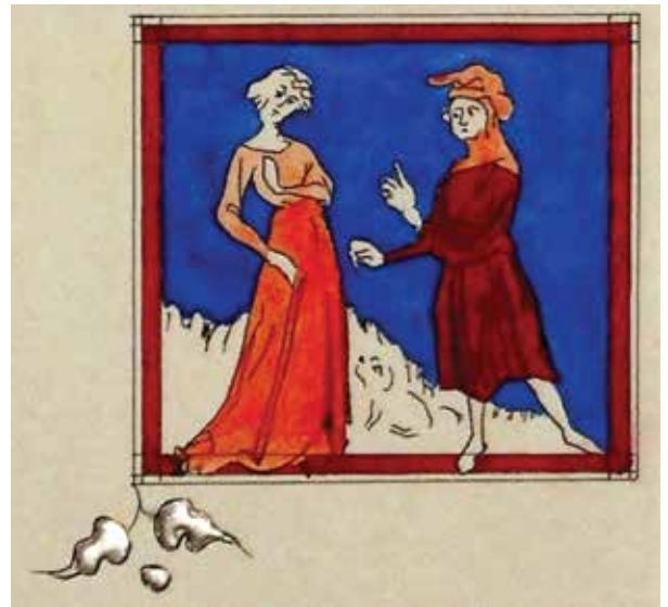
Restitution du Jeu de Robin et Marion par l'Atelier Saint Luc.