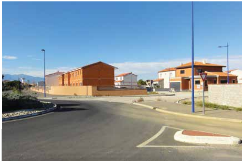
LES PORTES DE LA MER

Les abords de l'aire ont été aménagés dernièrement. Auparavant en terre, du gazon synthétique a été placé, une piste cyclable a été réalisée, des tables de pique-nique ont été installées pour les familles, de nouveaux espaces de jeux ont été créés (marelle, coccinelle, champignons).