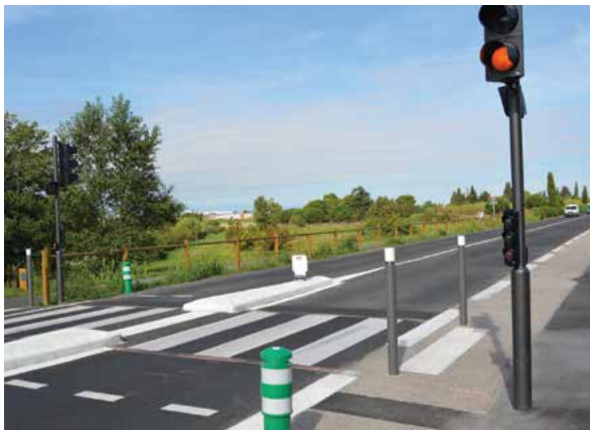
FEU « APPEL PIÉTON », ROUTE DE PERPIGNAN