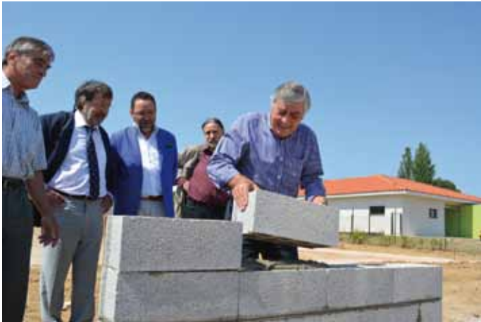
Première pierre du nouveau Centre de dépistage et de soins de la pédopsychiatrie -Centre hospitalier de Thuir, à Cabestany.