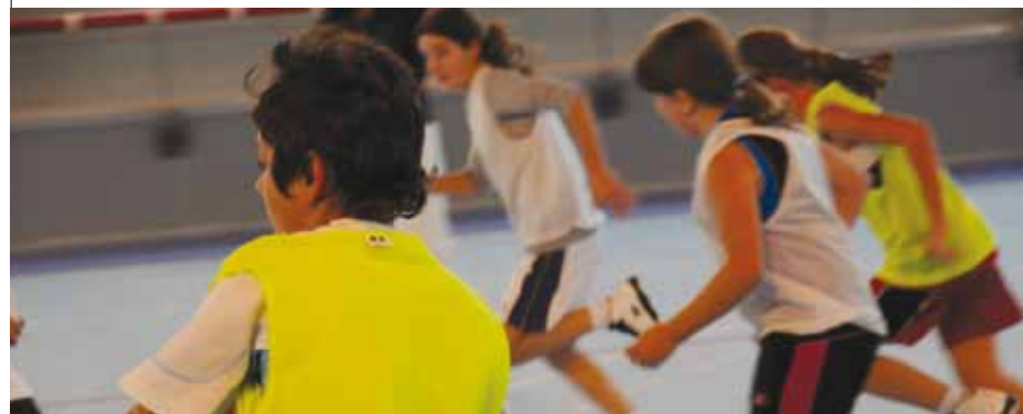
LE COMPLEXE TROUVE SON RYTHME

Le CCJ se réunit tous les vendredis de 17h à 19h à l'Espace Jeunesse. Renseignements : 04.68.67.59.81.