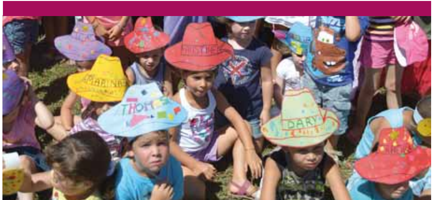
Activités à l'Accueil de loisirs.