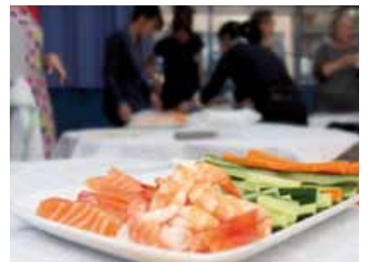
Mois du Japon à la bibliothèque !