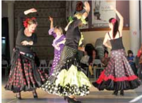
Faites de la citoyenneté 2013.