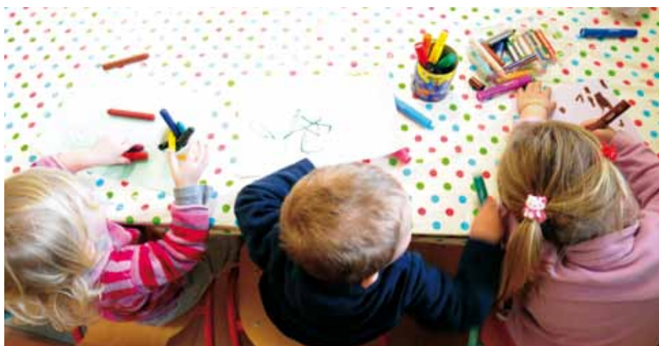
LA RENTRÉE DU MULTI-ACCUEIL