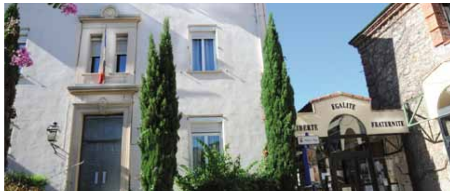
LA RENTRÉE DU CCJ

C'est le nouvel atelier proposé à la Germanor pour les enfants. Ils vont apprendre la coordination, la concentration et l'attention de manière ludique. Deux ateliers auront lieu, pour les 5/7 ans et à partir de 8 ans, les mercredis.