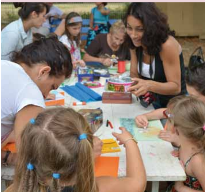
Ludorie d'été au Parc Guilhem.