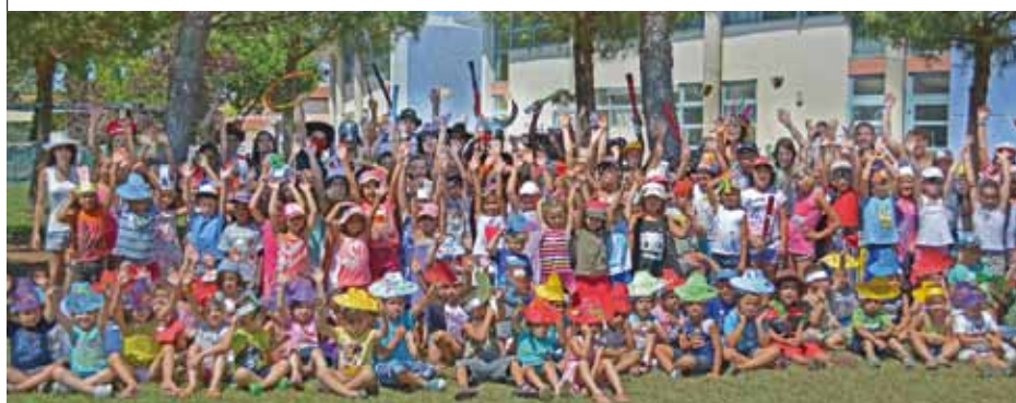
ACCUEILS DE LOISIRS

Le Lieu d'Accueil Enfants Parents (LAEP) ouvrira ses portes le 17 septembre et sera officiellement inauguré en octobre. Il connaît un succès si sincère que des mamans souhaitent continuer à y passer, alors que leurs enfants quittent la crèche pour entrer à l'école.