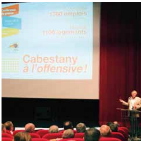
Conférence de presse Habitat/Économie du 20/06/13.