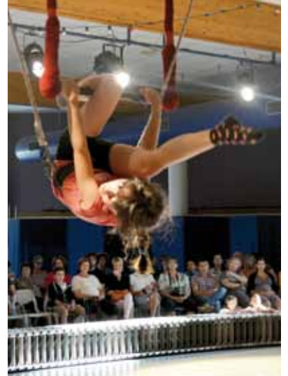
Juin des ateliers/le cirque.