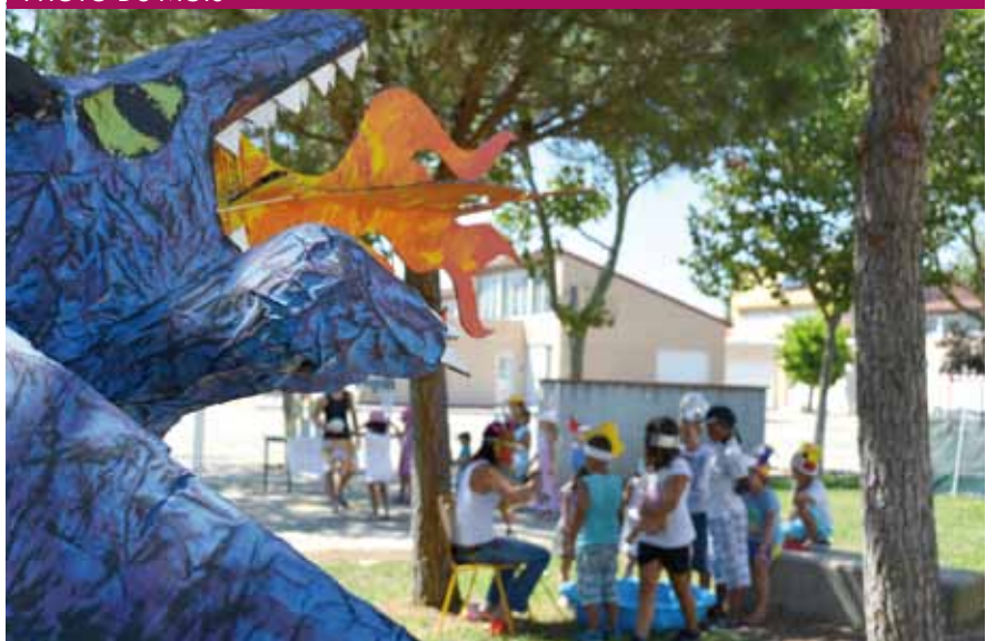
Activités à l'Accueil de loisirs.