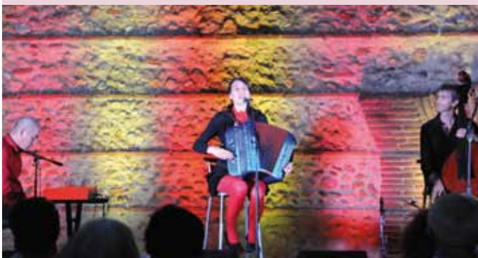
Dalele au Parc Guilhem.