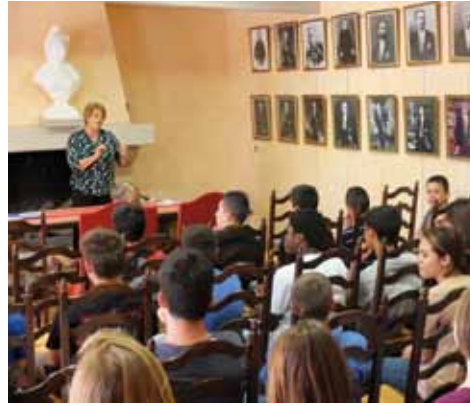
Les collégiens découvrent le fonctionnement municipal