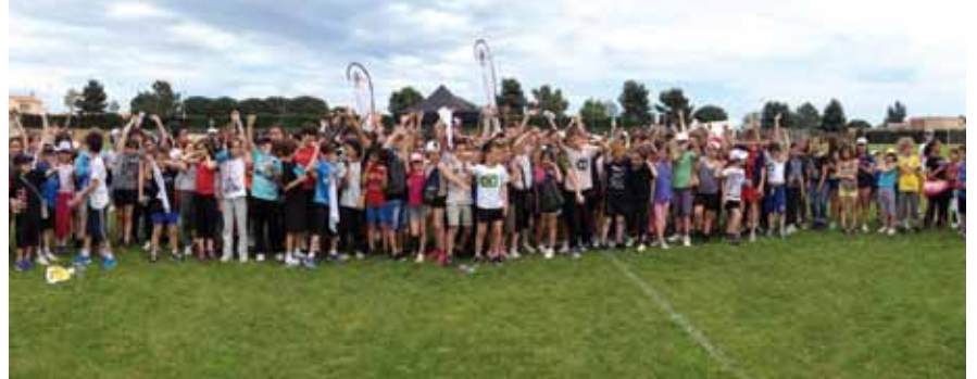
La Fête du sport al Camp de la Germanor