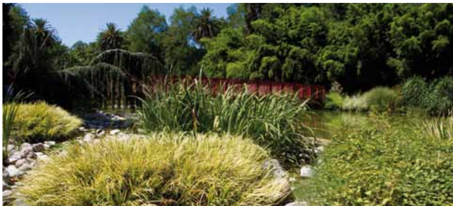
LE JARDIN DES PLANTES DE SAINT-CYPRIEN