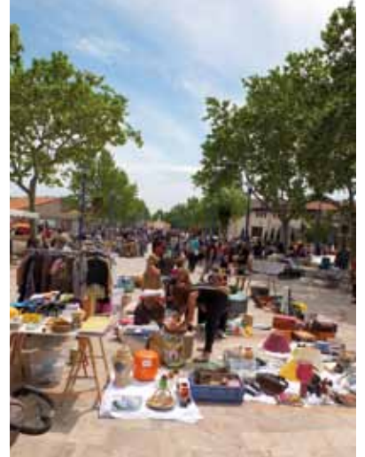
Plus de 320 exposants ... et beaucoup de monde au vide grenier