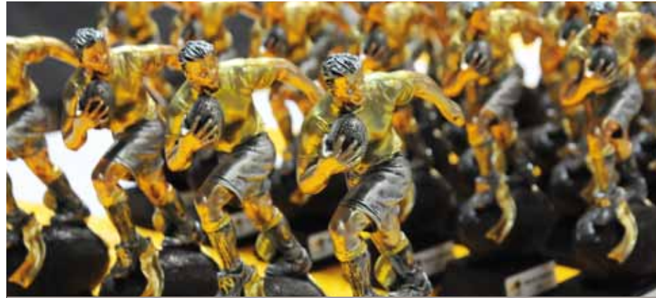
MÉDAILLES ET TROPHÉES