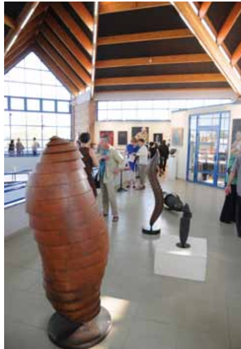
Vernissage de la 7 e Biennale de Printemps