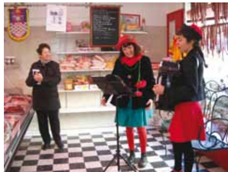
Le Printemps des Poètes et ses Brigades d'interventions poétiques