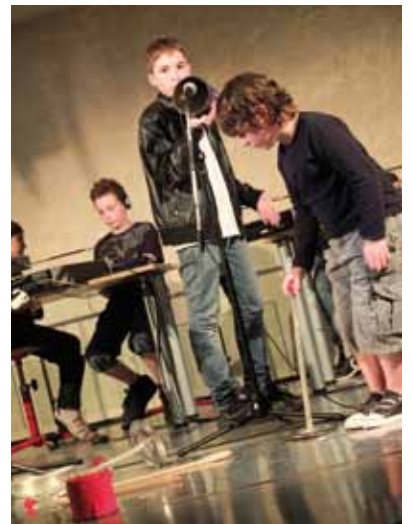
Concert électro-acoustique pour la Nuit des musées au Centre de Sculpture Romane