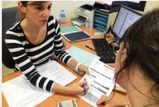
La conseillère en économie sociale et familiale réalise un travail global en amont sur le budget des foyers fragilisés.

Fin 2012, une conseillère en économie sociale et familiale a intégré le Service social, avec pour tâches d'établir des bilans, de réaliser de l'accompagnement, du suivi et de la prévention de situations difficiles, ainsi que le montage de