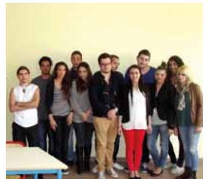
Service jeunesse : stage dans le cadre de l'aide au permis