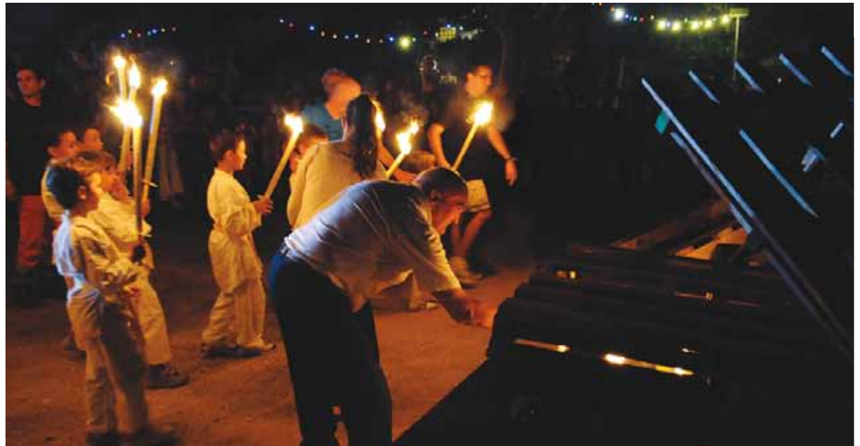
FEUX DE LA SAINT-JEAN LE 23 JUIN