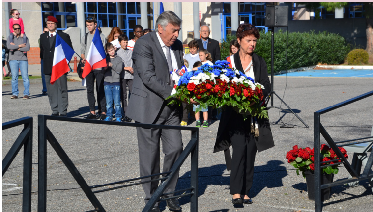
Cérémonie du 11 novembre.