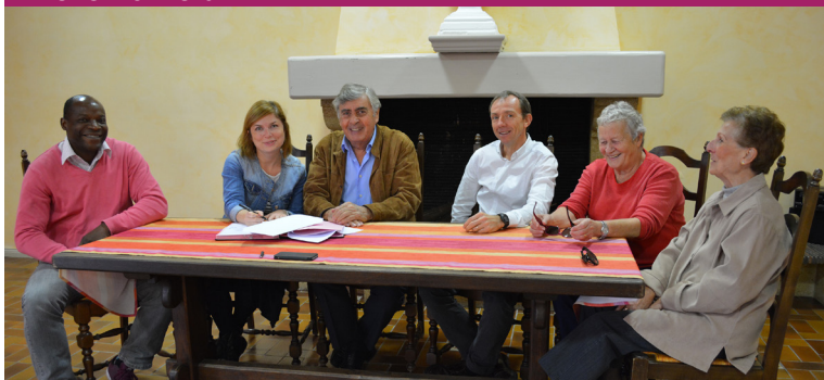
Signature de la convention de partenariat avec le Secours populaire pour la Cabestanyenca 2016.