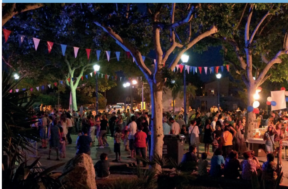
PLACE DU 8 MAI, LE 13 JUILLET

À 7h30. Multi-accueil. Rentrée du RAM et du LAEP, début septembre.