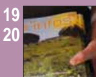
19 20 Votre avis nous intéresse