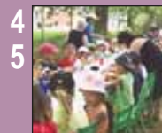
4 5 Social Citoyenneté