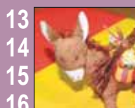
13 14 15 16 Culture