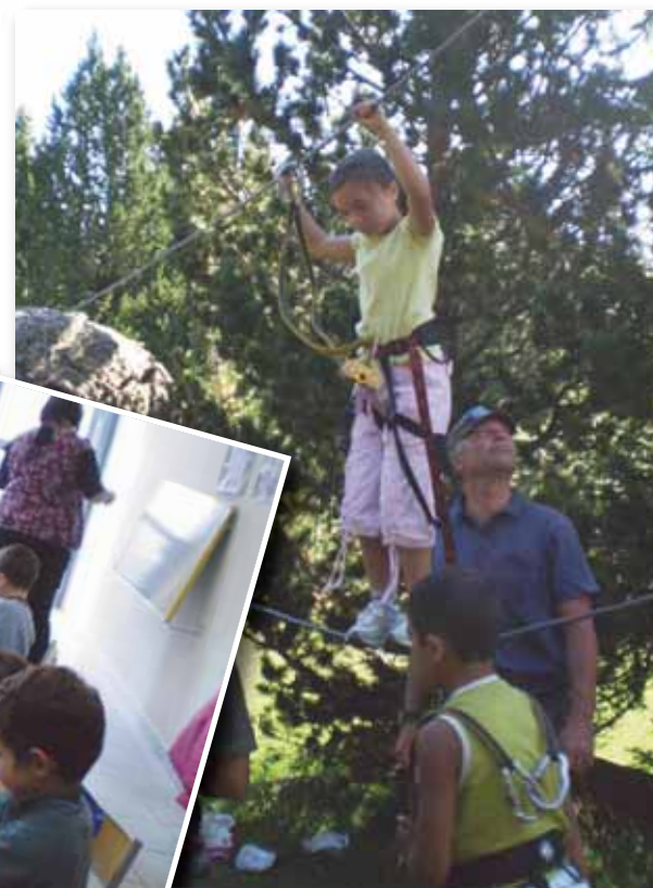
Quelques activités de l'été !