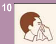
10 Pandémie grippale