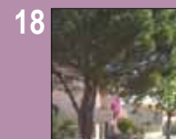
18 Services techniques Tribune opposition