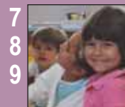
7 8 9 Dossier