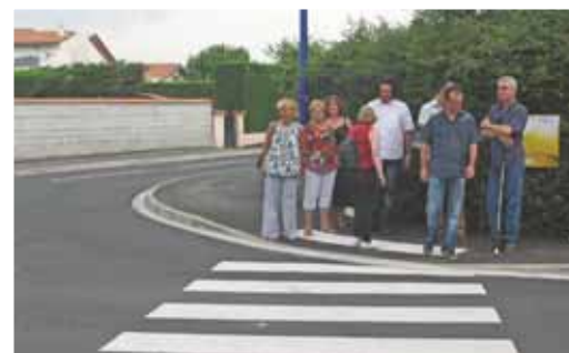
Visite de la Commission communale pour l'accessibilité des personnes handicapées et des Services Techniques et Urbanisme

Le 25 juin 2009, la commission communale pour l'accessibilité des personnes handicapées a effectué, avec les services techniques et urbanisme, une visite de terrain suite à l'aménagement du chemin du Mas dels Xots. Du fait de sa fréquentation croissante et depuis l'ouverture du groupe scolaire Ludovic Massé, la mise en sécurité du chemin, l'aménagement de la circulation douce ainsi qu'une meilleure accessibilité pour les personnes handicapées sont devenus des priorités communales. En effet, cette voie était dangereuse de part ses carrefours, ses trottoirs trop étroits et les vitesses pratiquées excessives. La réflexion de la chaussée était l'occasion de rénover le réseau d'assainissement ainsi que l'éclairage public. Le chantier a débuté en février 2009 et s'est terminé en mai. Cette opération s'intègre dans le Plan de Sécurisation des Déplacements élaboré avec la DDE en 2006.