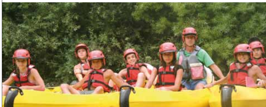
ACCUEIL DE LOISIRS

Les candidatures sont à adresser à : Monsieur le Maire - Président du CCAS Place des Droits de l'homme - 66330 Cabestany.