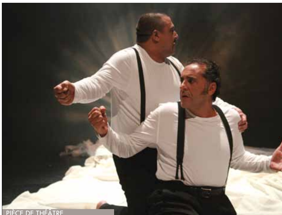
PIÈCE DE THÉÂTRE