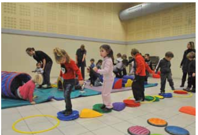
Séance de motricité pour les tout-petits.