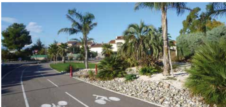
EMBELLISSEMENT DES ESPACES VERTS

Le parcours de santé et parc paysager Sainte Camille de 12,5 hectares, entre le Mas Guérido et le quartier San Galdric, est un lieu fréquenté par de nombreux cabestanyens, et pas seulement, qui ont plaisir à s'y promener. Ce formidable aménagement s'inscrit dans l'engagement écologique de Cabestany sur la zone de la « Ceinture verte ». Il a su préserver sa fonction initiale de bassin d'orage ainsi que la flore et la faune existante. Des haies d'arbustes longent le cours d'eau naturel et servent d'abri, de garde-manger et de zone de nidification aux diverses espèces d'animaux (lapin, hérisson, etc.). Plus de 300 essences méditerranéennes (chênes, oliviers, peupliers...) ont été plantés complétant les variétés d'arbre d'origine comme les pins parasols, figuiers et peupliers. Afin de profiter du lieu en famille, tout en respectant la propreté, des aires de pique-nique ont été aménagées, équipées de poubelles qui sont relevées régulièrement par les agents municipaux. Après quelques années d'existence, le Bassin Sainte Camille est devenu le lieu de détente privilégié des habitants.