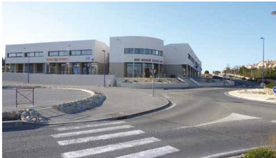
EXPANSION DU TISSU ÉCONOMIQUE

Tous les ans au mois de mai, un vide grenier est organisé sur la place du 8 mai 1945 et ses abords. En raison de la date des élections présidentielles, le prochain est arrêté au dimanche 29 avril 2012.