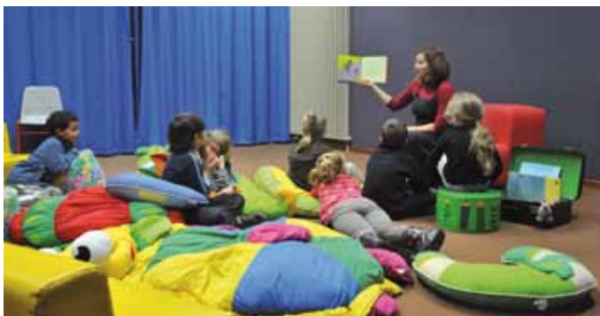
« Le p'tit raconteur » à la bibliothèque municipale.