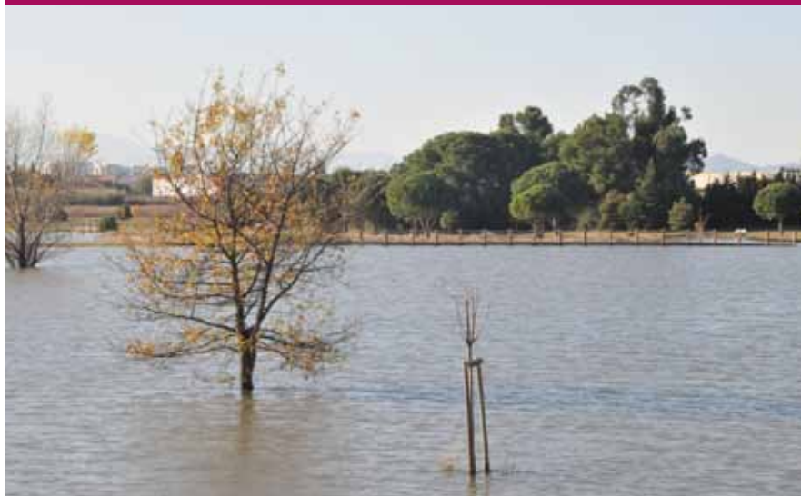
Le bassin d'orage Sainte Camille après les pluies du 21 novembre.