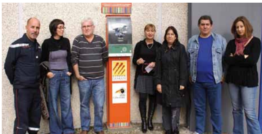
Formation des agents municipaux au maniement du défibrillateur cardiaque à l'entrée du Centre culturel Jean Ferrat.