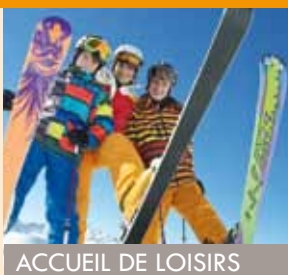
ACCUEIL DE LOISIRS

Au rendez-vous, des animations sportives et culturelles, comme le paintball , cinéma, bowling... et la visite guidée dans la ville catalane de Gérone, pour les fêtes de la Sant Narcis qui a clôturé la semaine de vacances. Les adolescents ont apprécié les styles architecturaux et l'histoire de la ville.