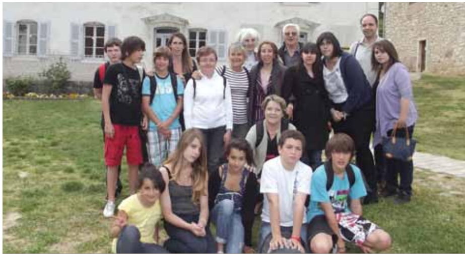
TRANSMISSION DE L'HISTOIRE AUX JEUNES