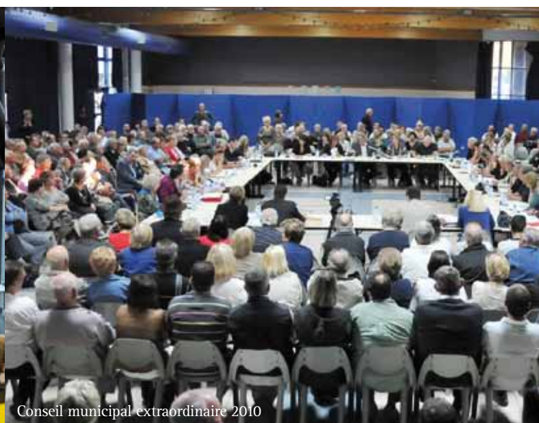
Conseil municipal extraordinaire 2010