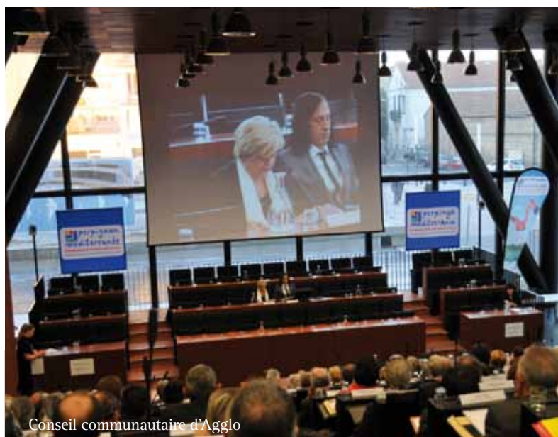
Conseil communautaire d'Agglo