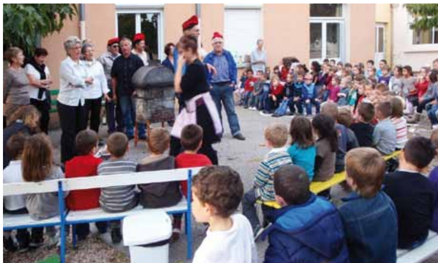
La « castanyada » à l'école Jean de La Fontaine.