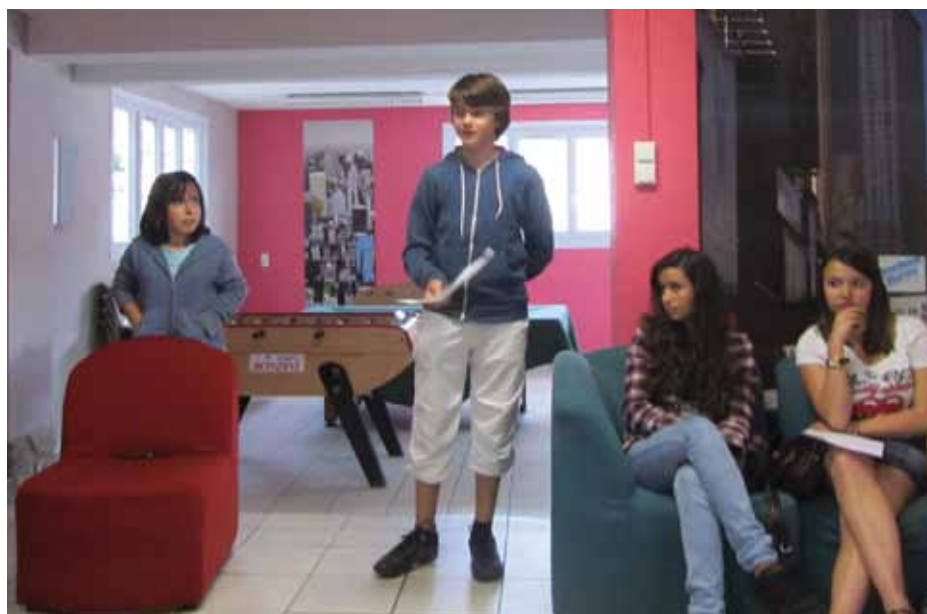
À L'ÉCOUTE DES JEUNES