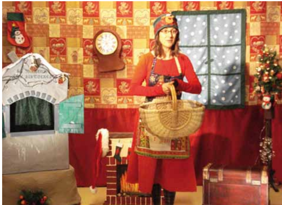
CONTES DE NOËL

JANVIER ! PHILOSOPHIE* Mercredi 25 janvier 2012 Spectacle et débat autour du « pouvoir ».