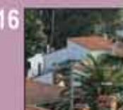
16 Services techniques Tribune opposition