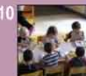
10 Enfance Petite enfance