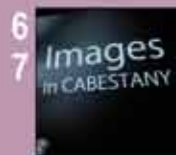
6 7 Rencontre court métrage