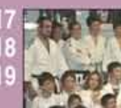
17 18 19 Associations