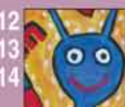
12 13 14 Culture