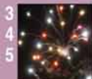
3 4 5 Voeux