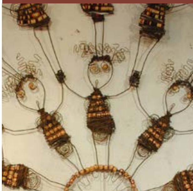
« SARDANE » PAR ALEXIS LASK.