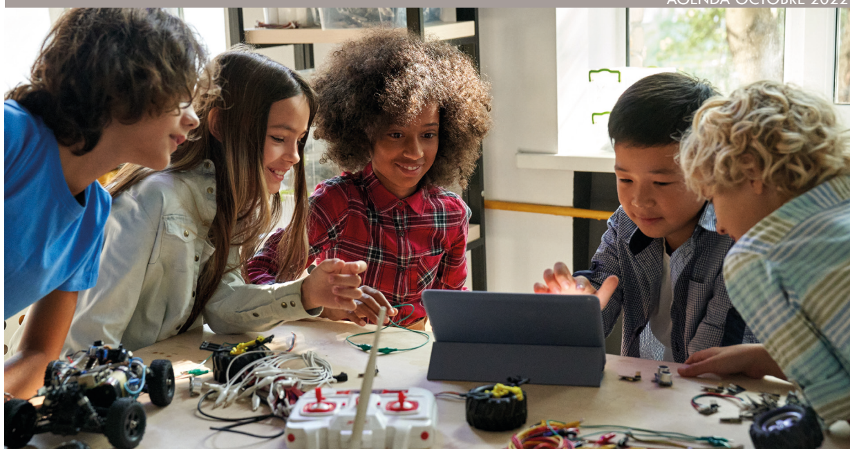
LA CODE WEEK « CHALLENGE ROBOTIQUE ». SAMEDI 22 OCTOBRE À LA BIBLIOTHÈQUE.