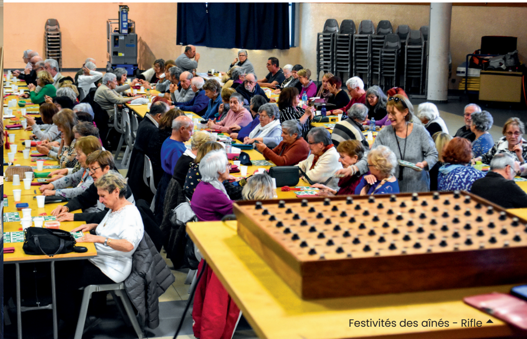
Festivités des aînés - Riffle ▲