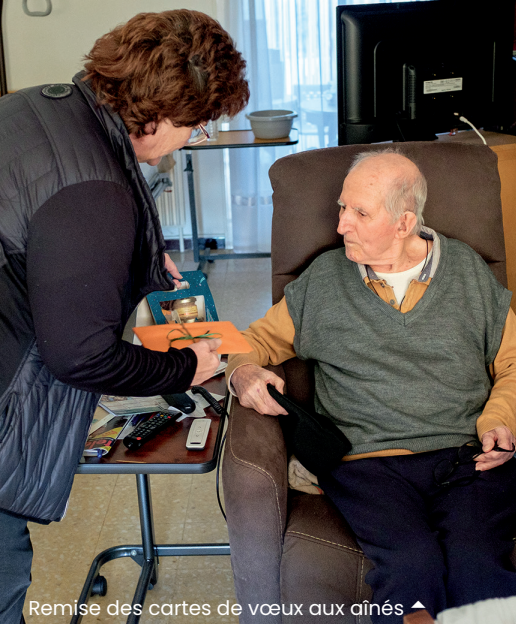
Remise des cartes de vœux aux aînés ▲