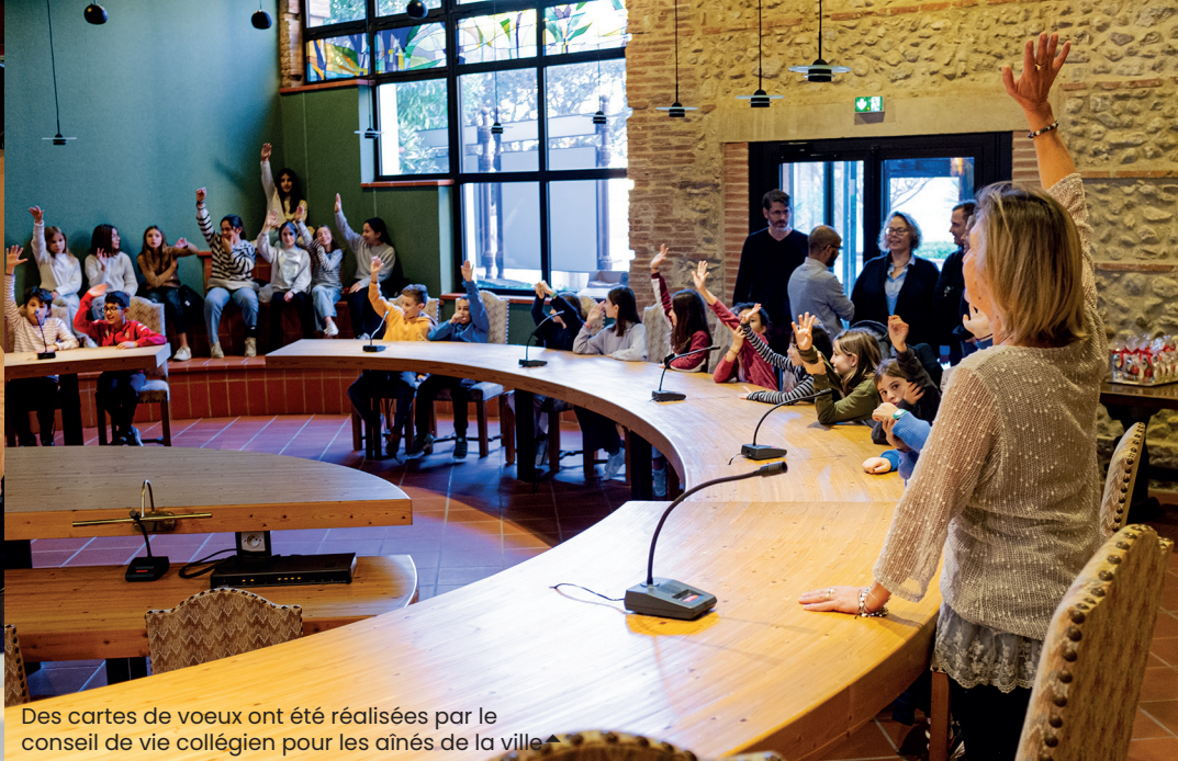
Des cartes de vœux ont été réalisées par le conseil de vie collégien pour les aînés de la ville ▲