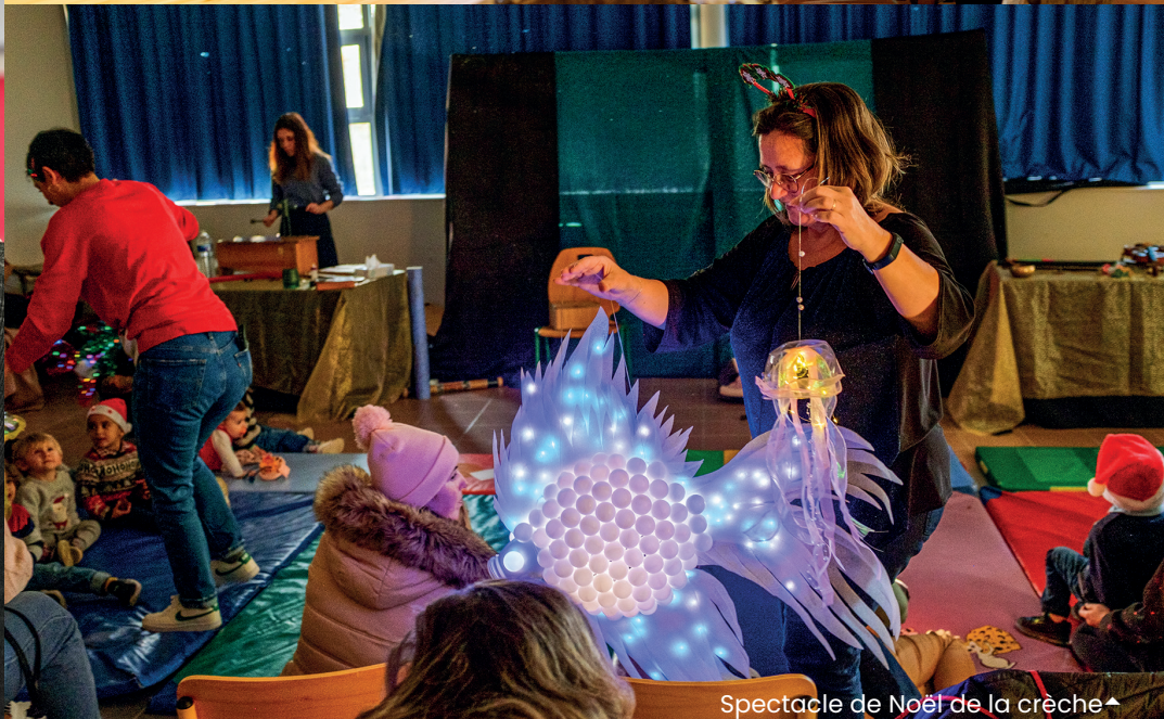
Spectacle de Noël de la crèche ▲