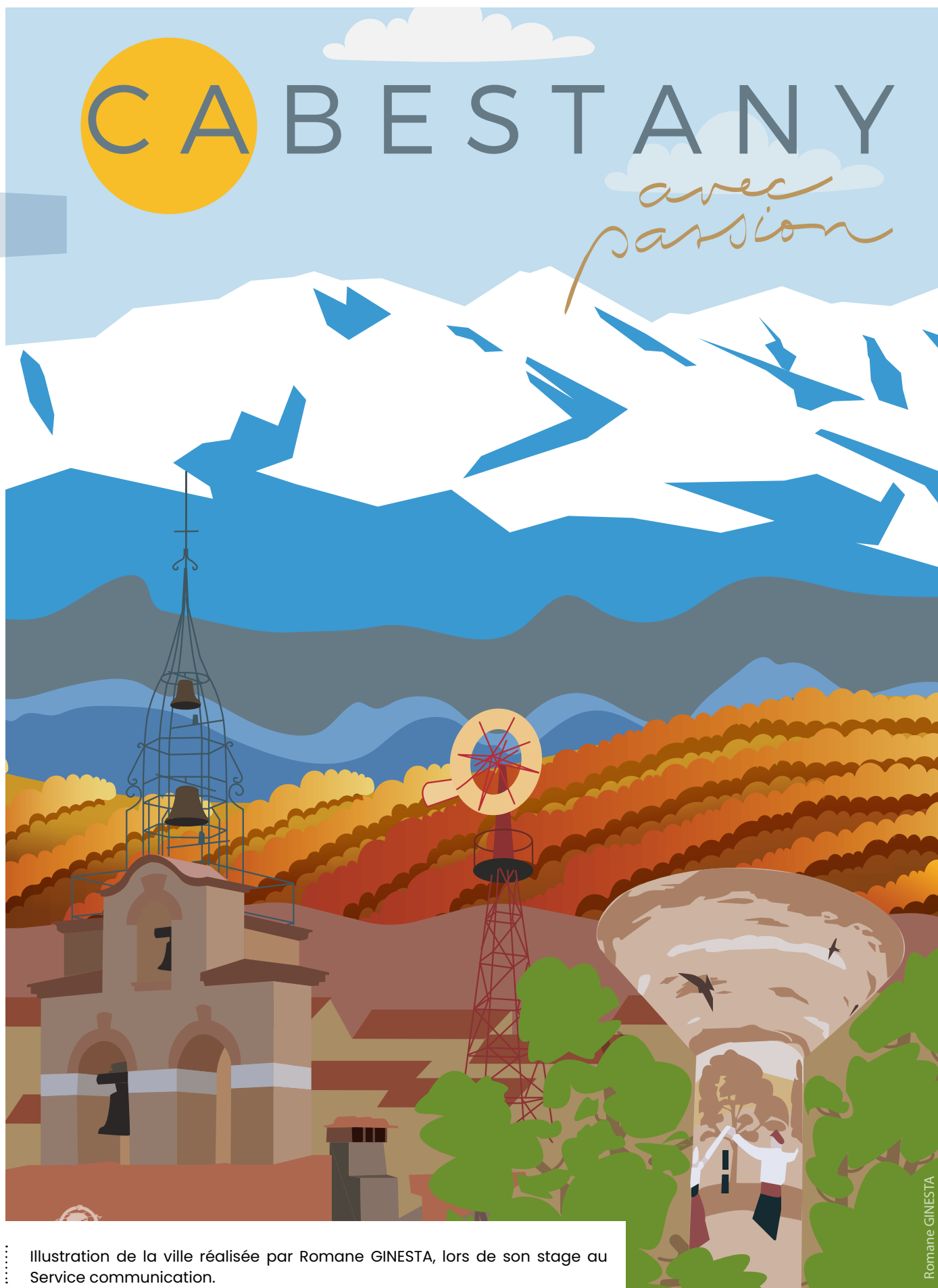
..... Illustration de la ville réalisée par Romane GINESTA, lors de son stage au Service communication.