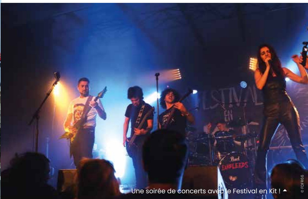
Une soirée de concerts avec le Festival en Kit ! ▲