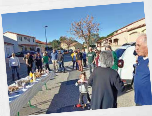
Gouters de quartiers