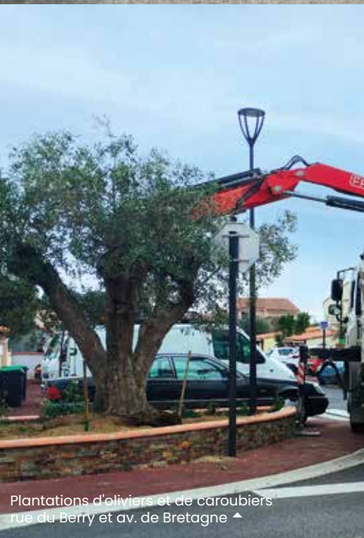
Plantations d'oliviers et de caroubiers rue du Berry et av. de Bretagne ▲