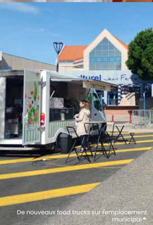
De nouveaux food trucks sur l'emplacement municipal ▲