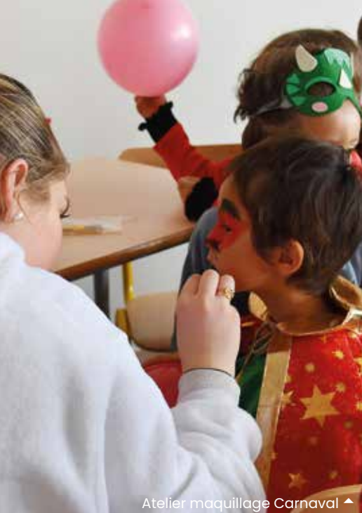
Atelier maquillage Carnaval ▲