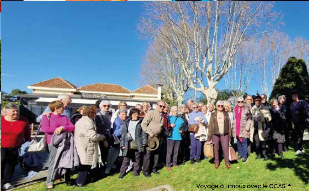
Voyage à Limoux avec le CCAS ▲

Découvrez toutes les photothèques sur www.ville-cabestany.fr