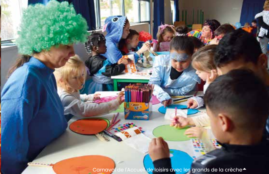
Carnaval de l'Accueil de loisirs avec les grands de la crèche ▲