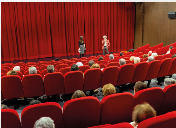
Projection du film "Josep"