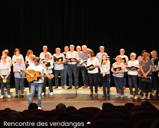
Rencontre des vendanges ▲