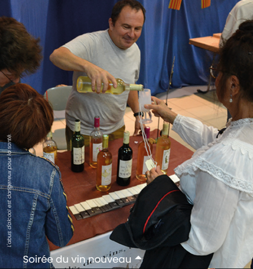
Soirée du vin nouveau ▲

Labus d'alcool est dangereux pour la santé.