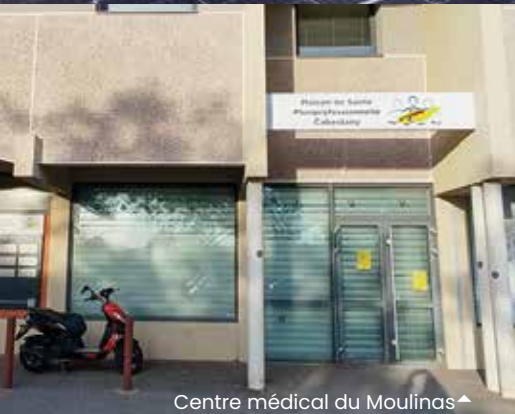
Centre médical du Moulinas ▲