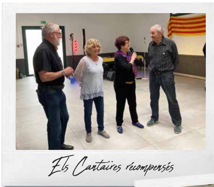
Els Cantaires récompensés