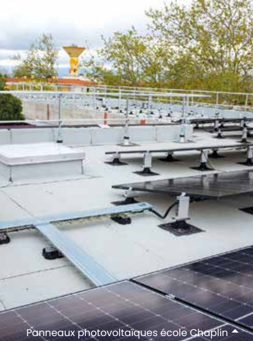
Panneaux photovoltaïques école Chaplin ▲