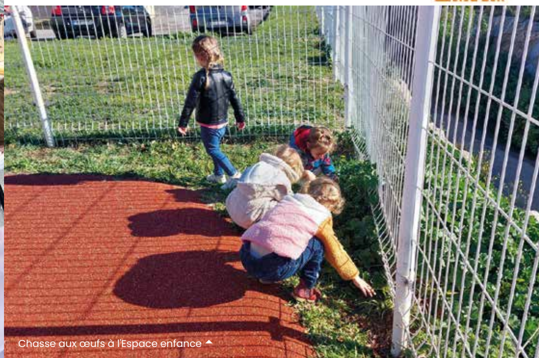
Chasse aux œufs à l'Espace enfance ▲