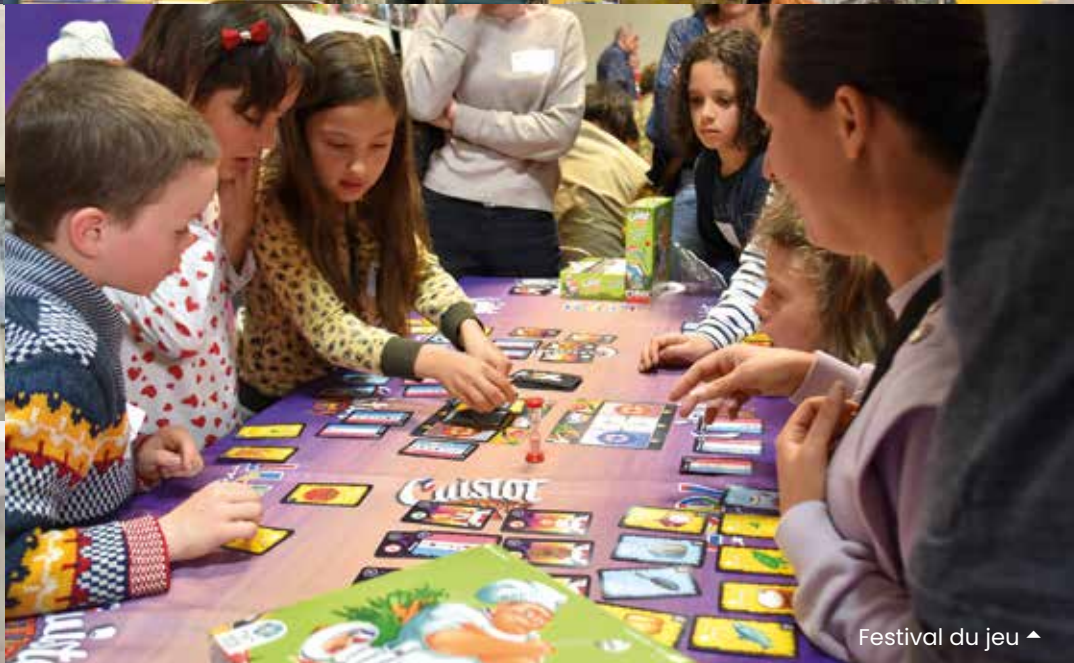
Festival du jeu ▲

Découvrez toutes les photothèques sur www.ville-cabestany.fr