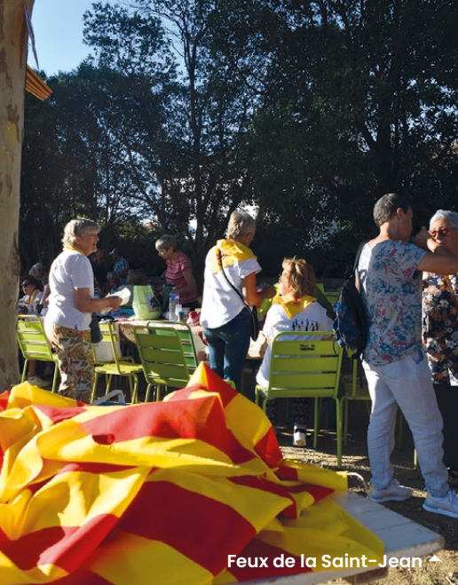
Feux de la Saint-Jean ▲