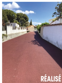
R. des Rouquettes / Av. F. Mitterrand