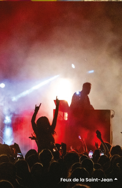
Feux de la Saint-Jean ▲