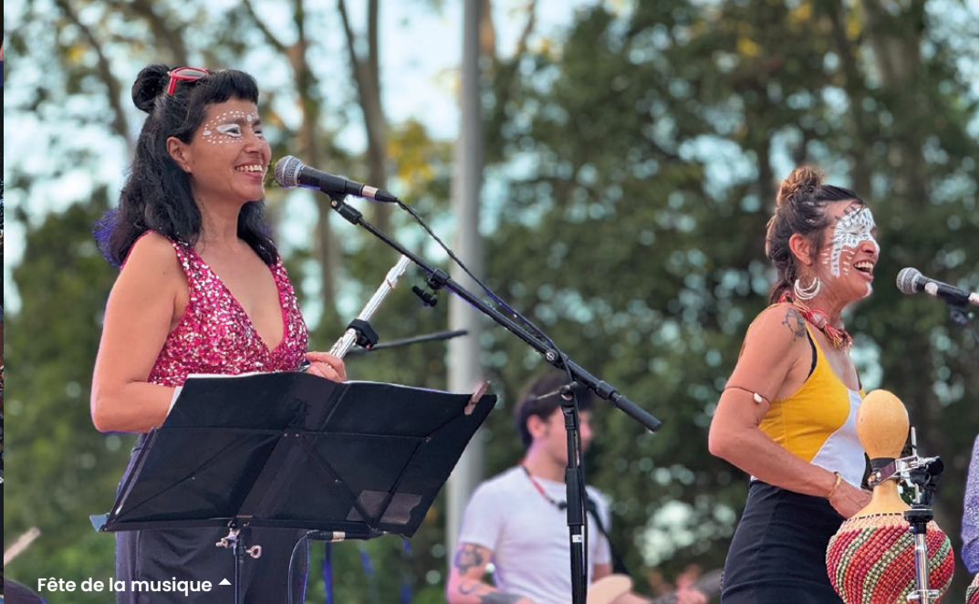
Fête de la musique ▲