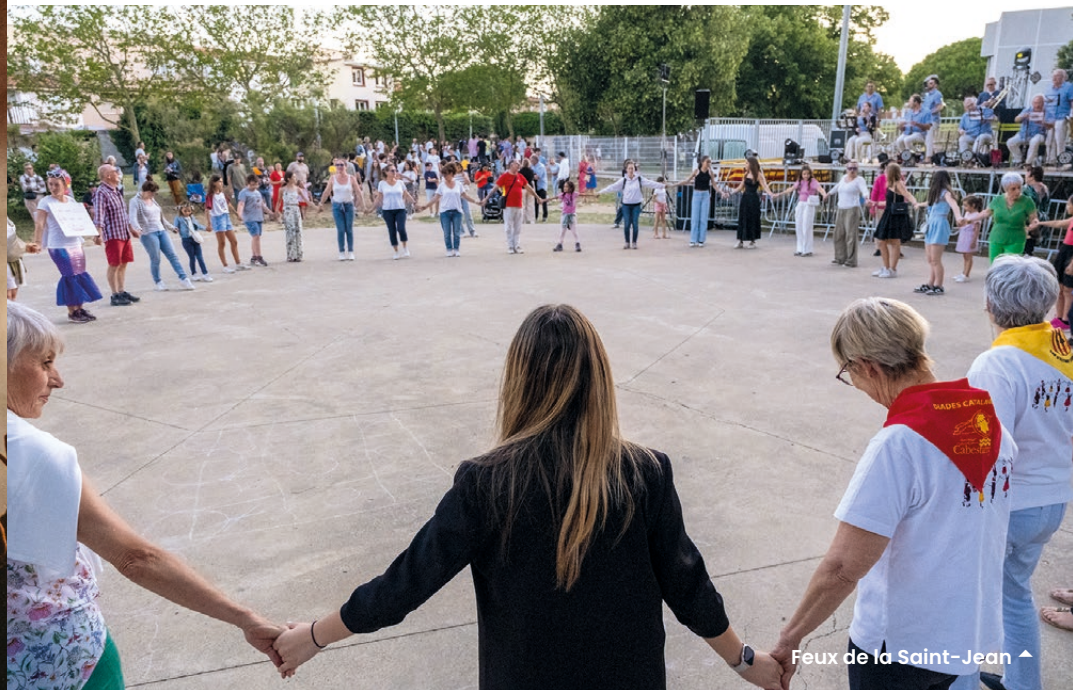
Feux de la Saint-Jean ▲

Découvrez toutes les photothèques sur www.ville-cabestany.fr