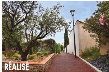
Rue du Berry / Av. G de de Gaulle