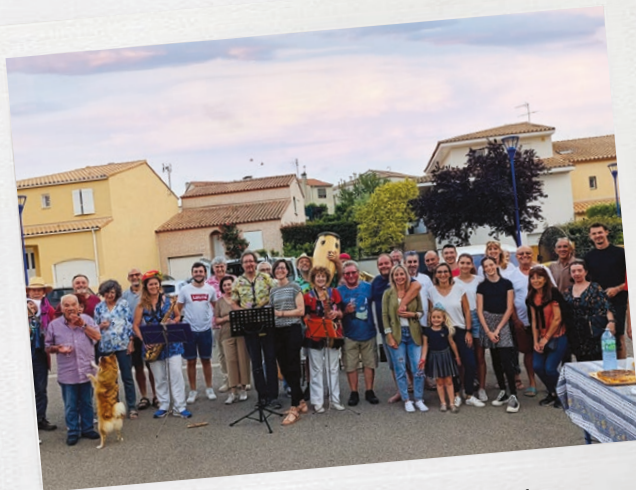
Premiers repas de quartier