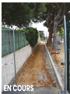
R. de Picardie / Parc de la Poste