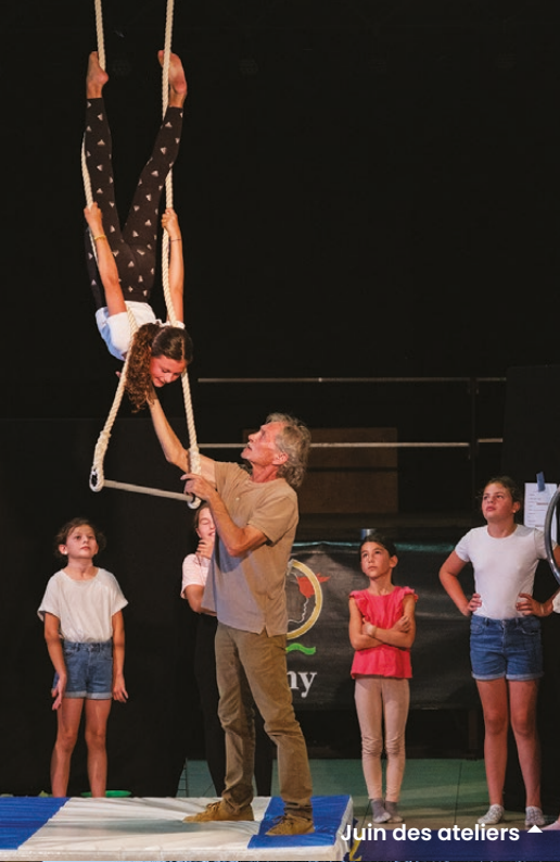
Juin des ateliers ▲