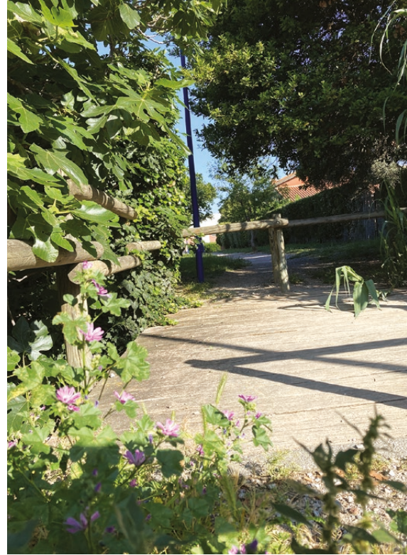
Croisement av. Carbonnell/rue des Lilas