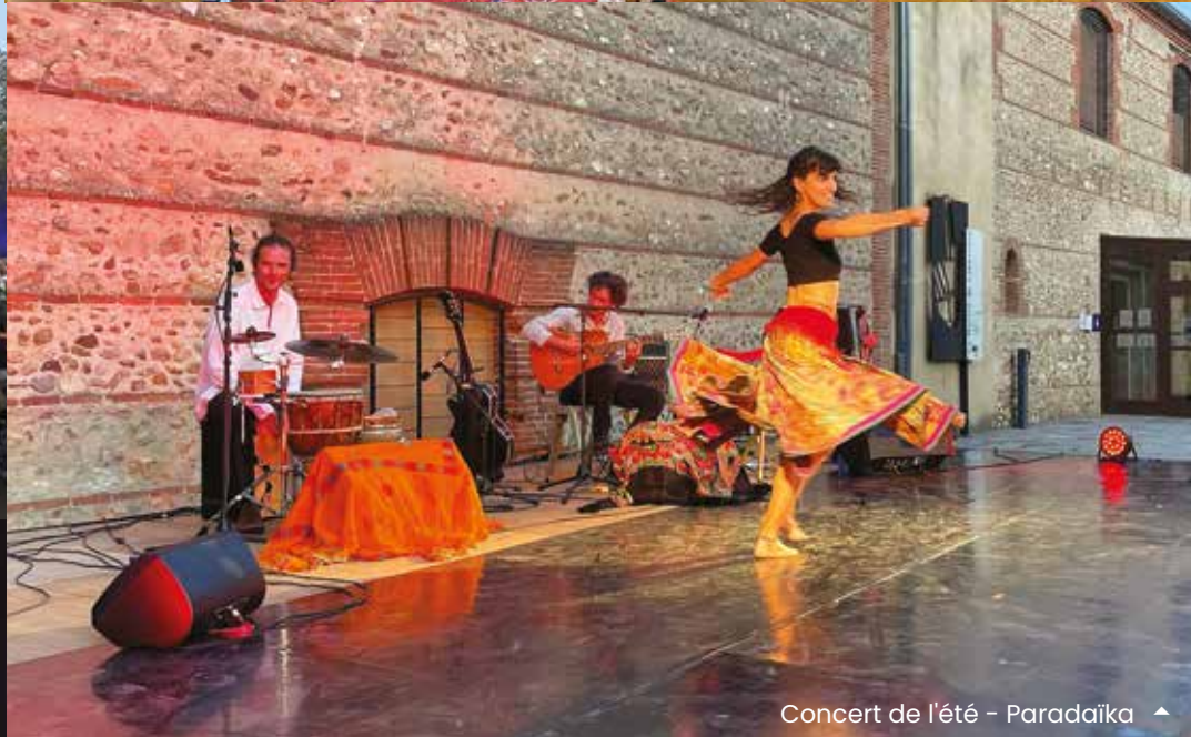
Concert de l'été - Paradaïka