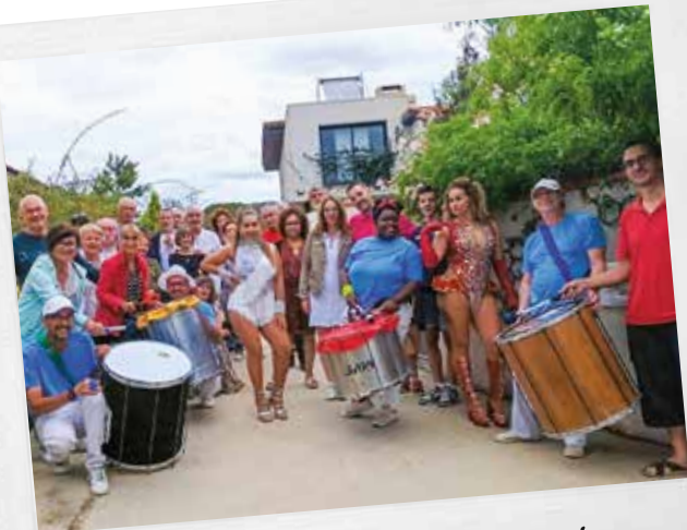
Les Repas de quartier !