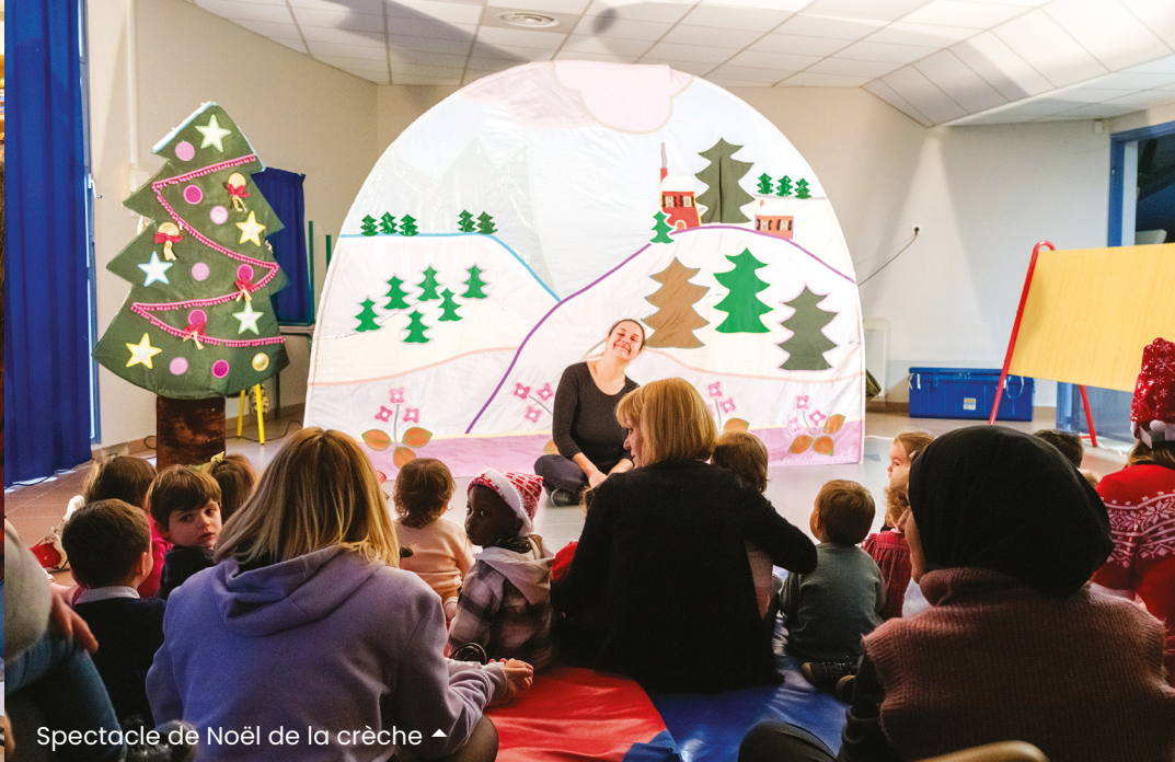
Spectacle de Noël de la crèche ◀