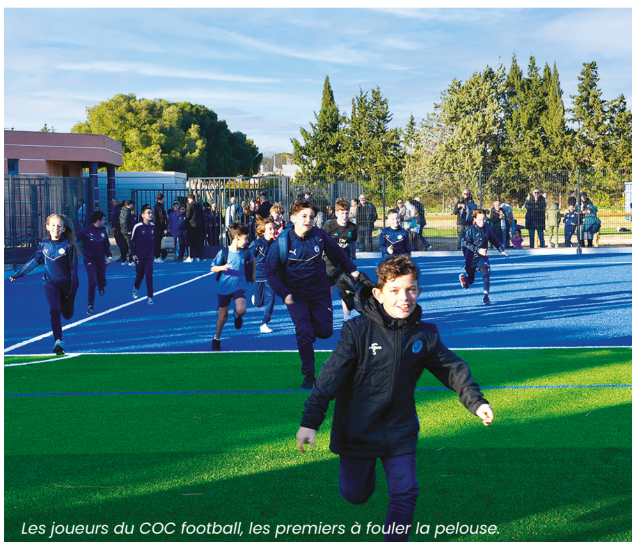
Les joueurs du COC football, les premiers à fouler la pelouse.

M 3 D'ÉCONOMIE D'EAU PAR AN POUR LA GERMANOR