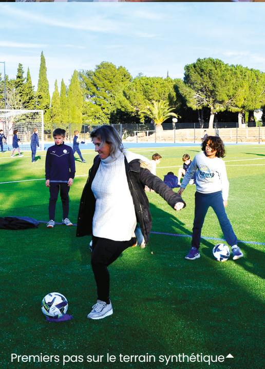
Premiers pas sur le terrain synthétique ◀