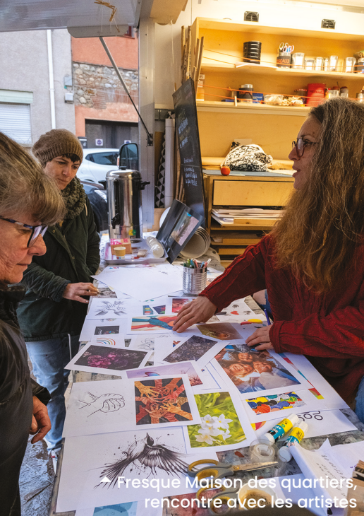
► Fresque Maison des quartiers, rencontre avec les artistes