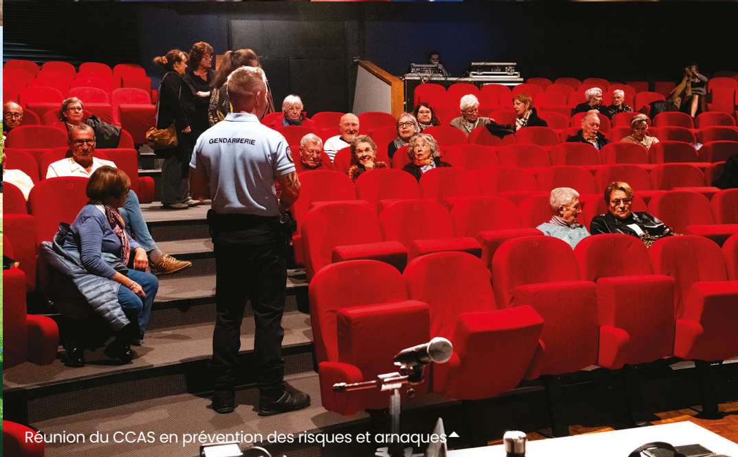
Réunion du CCAS en prévention des risques et arnaques ◀

Découvrez toutes les photothèques sur www.ville-cabestany.fr