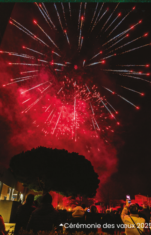
◀ Cérémonie des vœux 2025 ▶