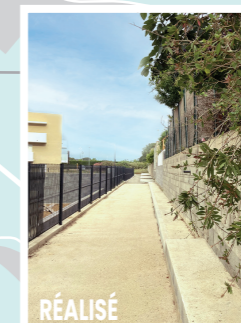
RÉALISÉ Rte de Saleilles / Quartier de la Germanor