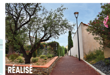
RÉALISÉ Rue du Berry / Av. G al de Gaulle