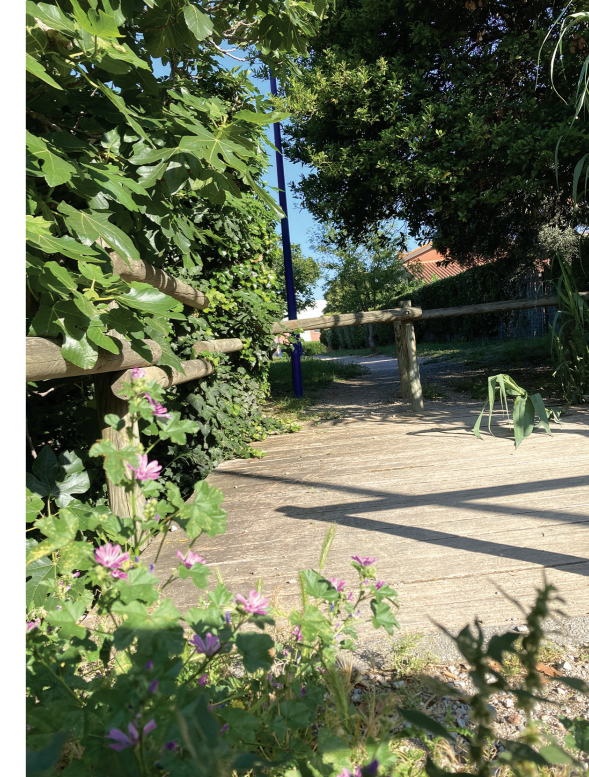
Croisement av. Carbonnell/rue des Lilas