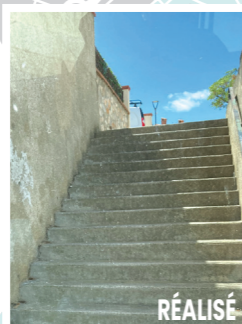
RÉALISÉ R. Chênes-lièges / R. San Vicens