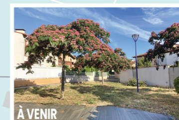
À VENIR Bajoles