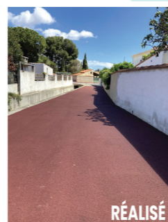
RÉALISÉ R. des Rouquettes / Av. F. Mitterrand