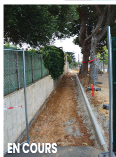
EN COURS R. de Picardie / Parc de la Poste